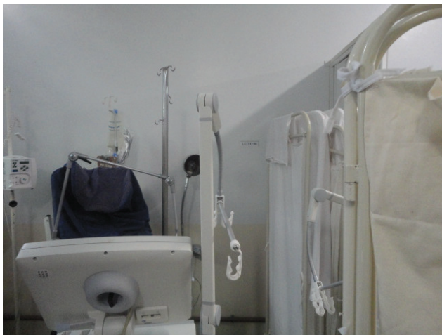
Leito desativado na UTI funcionando como depósito