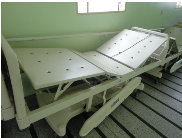
Cama leito de UTI com defeito colocada no corredor da unidade