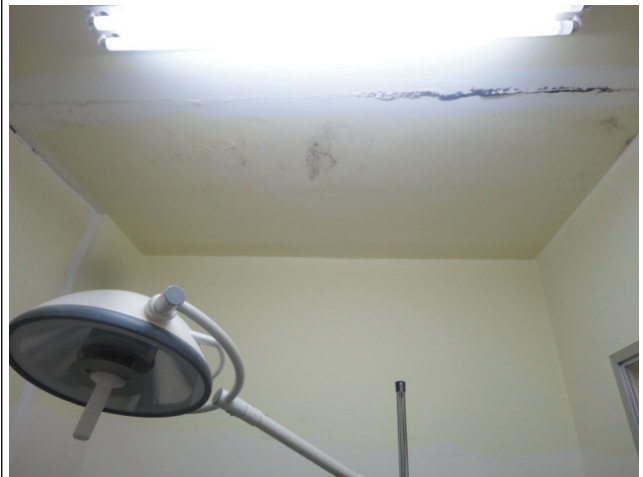
Local de goteira no teto da UTI pediátrica