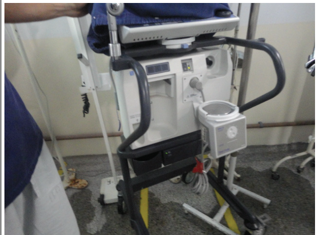
Respirador com defeito por falta de filtro