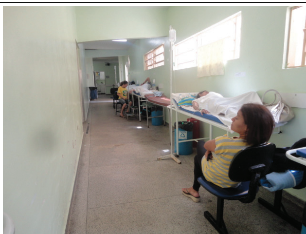
Pacientes em macas aguardando vagas de internação