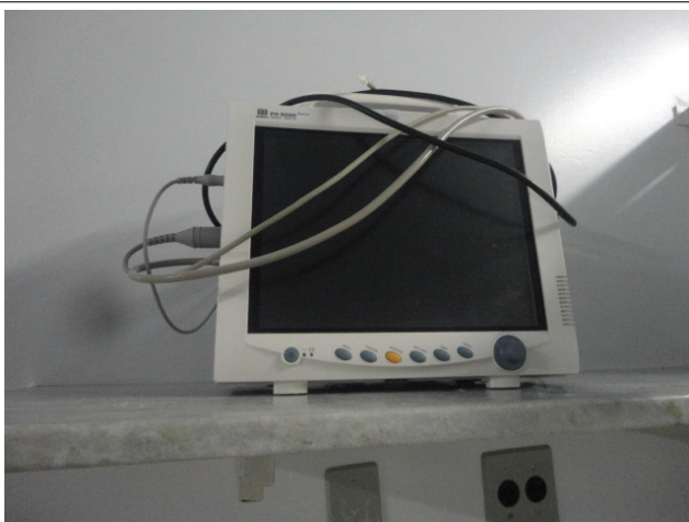
Monitor cardíaco estragado por falta de cabos