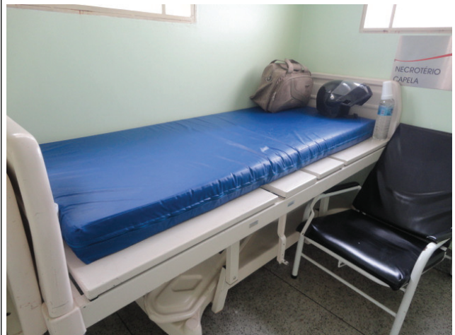
Cama leito de UTI com defeito colocada no corredor da unidade