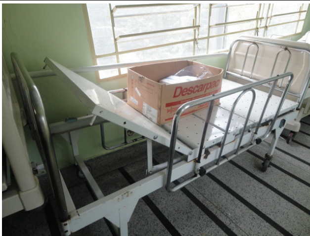
Cama leito de UTI com defeito colocada no corredor da unidade