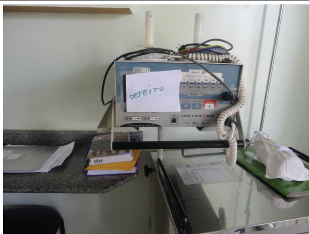
Respirador com defeito