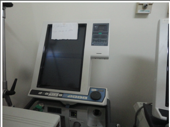
Respirador com defeito