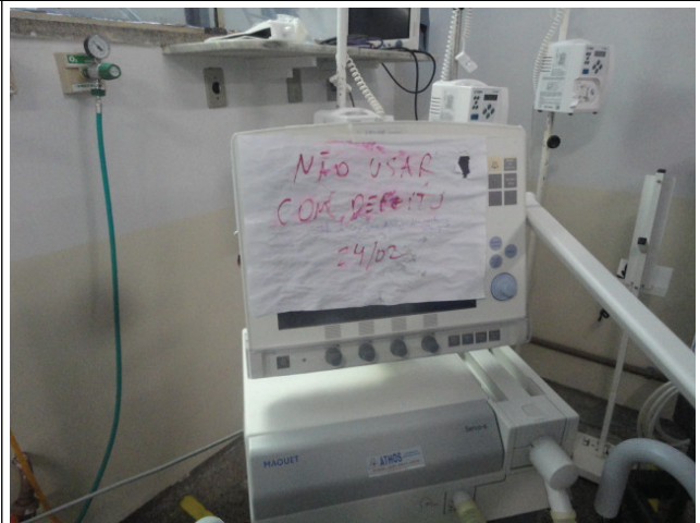
Respirador com defeito