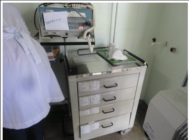
Respirador com defeito