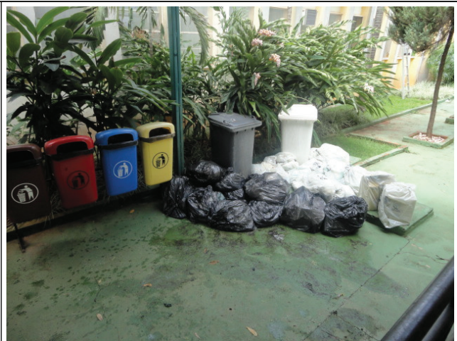
Lixo aguardando no corredor da unidade