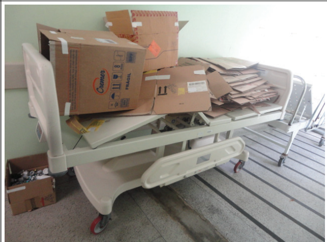
Cama leito de UTI com defeito colocada no corredor da unidade