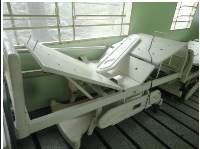
Cama leito de UTI com defeito colocada no corredor da unidade