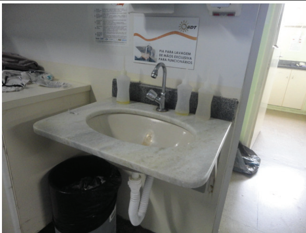
Bacia pequena para higienização das mãos na UTI