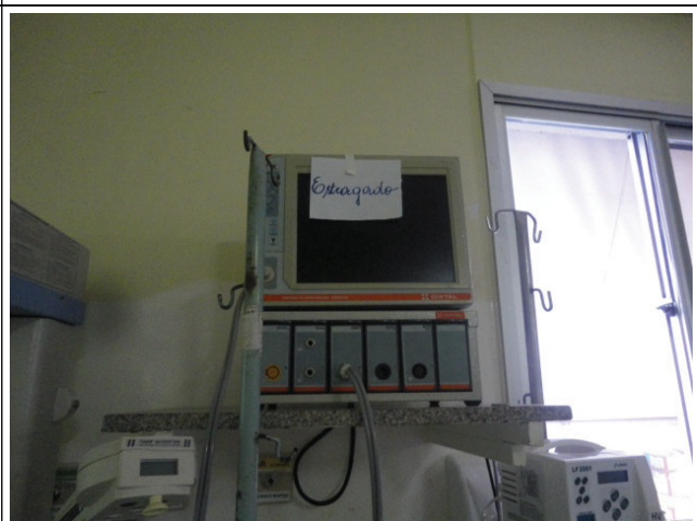
Respirador com defeito