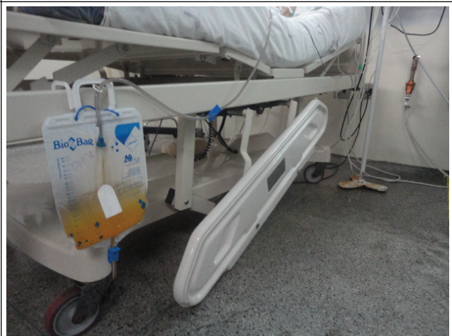
Cama leito de UTI com defeito sendo usada sem a grade lateral