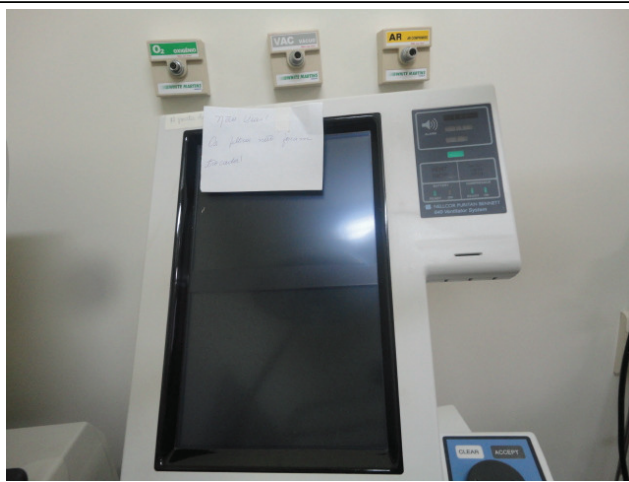
Respirador com defeito

HDT - Hospital de Doenças Tropicais- Rel.. 058/2012