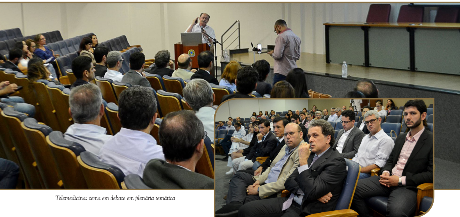
Telemedicina: tema em debate em plenária temática

"A criação da nova câmara foi anunciada pelo Cremego na plenária temática que debateu a telemedicina e a resolução do Conselho Federal de Medicina revogada um dia após o debate"