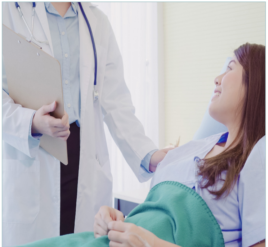
Cremeço defende melhorias na saúde pública

Mas, antes mesmo do início da vigência desta determinação que visava a resguardar a se-