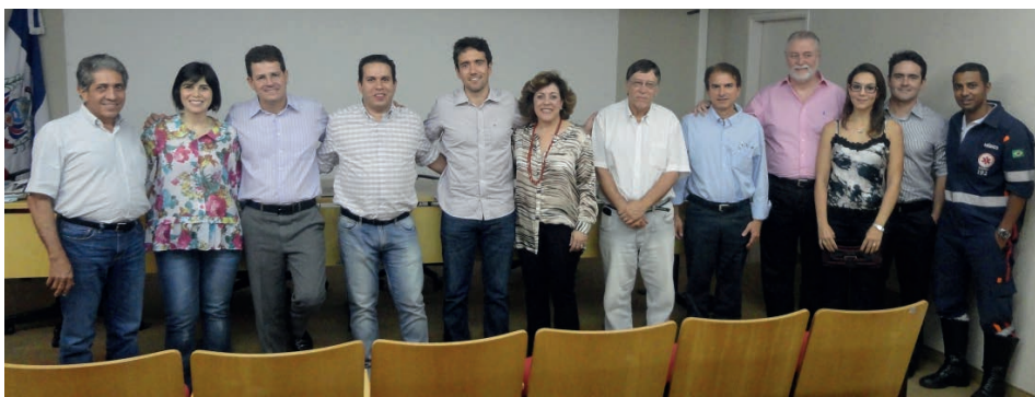
Morrinhos e Itumbiara: posse para mandato de 30 meses