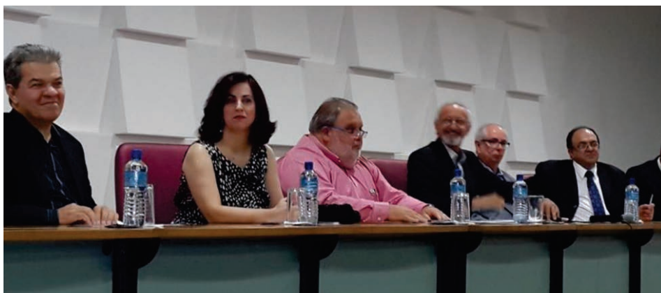
Solenidade: entrega de carteiras e destaque da importância da ética

O presidente foi claro ao enfatizar que o médico jamais pode alegar desconhecimento do Código de Ética Médica, a “bíblia” da profissão. “Tenham esse código sempre ao alcance para nortear sua atuação e esclarecer seus pacientes, quando questionados sobre algum procedimento que possa ferir a ética médica”, aconselhou.