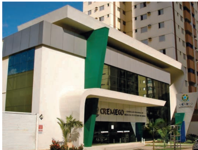
Cremego: Ouvidoria aberta aos médicos e à população

O telefone da Ouvidoria é o (62) 3250 4930. Todas as ligações são gravadas e as chamadas são automaticamente transferidas para o celular do ouvidor de plantão. Se por algum motivo a ligação não for atendida, o telefonema é encaminhado para o celular do coordenador da Ouvidoria.