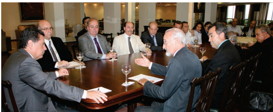
Reunião: apoio ao projeto e pedido de implantação do PCCV

Extraordinária do Simego, realizada no dia 22 de abril, a categoria deliberou que somente aceitará a proposta aprovada na Mesa de Negociação Permanente e que prevê carreiras de médicos e odontólogos separadas das demais categorias.